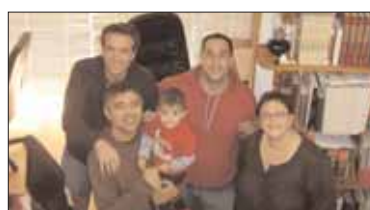
Silan Procesos Multimedia.